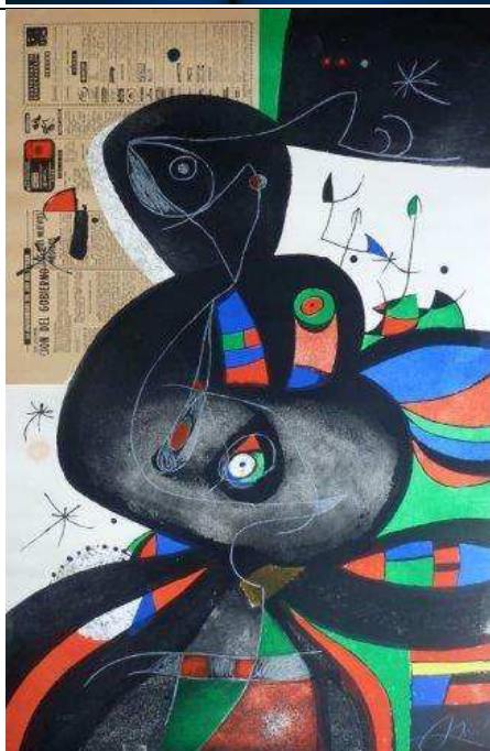
Joan Miró Série Gaudi , 1975-1979 Planche XXI Gravure 1,15 x 0,715 m Collection musée Goya N° inv. 2005-5-1