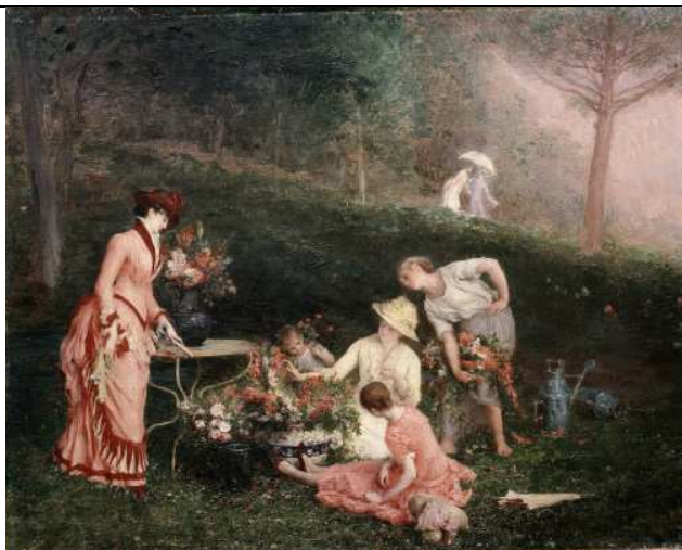
Marcel Bruguiboul L'Arrangement des bouquets , s.d. Huile sur toile 0,80 x 0,995 m Collection musée Goya N° inv. 28-1-168