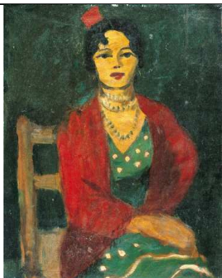
Eduardo Garcia Benito Espagnole au peigne rouge , 1955 Huile sur bois 0,41 x 0,33 m Collection musée Goya N° inv. 55-5-1