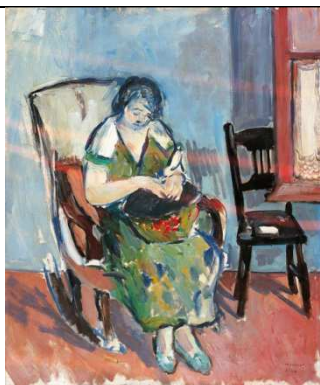
Joseph Mompou Femme cousant , 1924 Huile sur toile 0,73 x 0,60 m Collection musée Goya N° inv. D 55-1-3