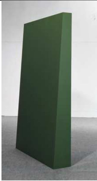
Jean-Gabriel Coignet Sculpture opaque , 1991 Tôle soudée peinte 1,50 x 0,90 x 0,30 cm Collection Les Abattoirs, Toulouse