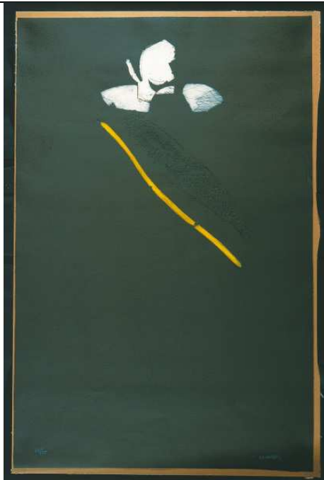
Manolo Valdés Conte duc d'Olivares II , 1986 Gravure 0,965 x 0,635 m Collection musée Goya N° inv. C 2001-13-2