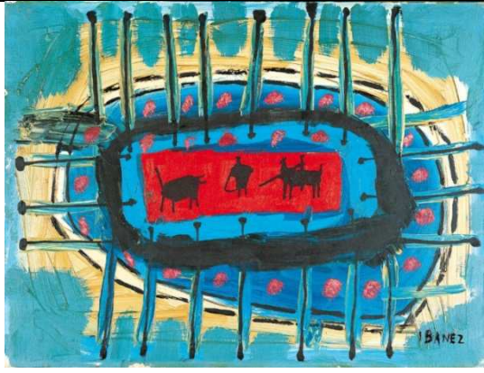
Enrique Ibañez Course de taureaux , 1957 Huile sur toile 0,46 x 0,615 m N° inv. 58-1-1 Collection musée Goya