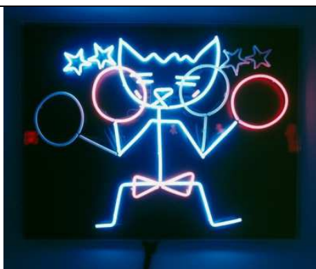
Alain Séchas Chat boxeur , 1998 Œuvre en trois dimensions, installation avec de la lumière Tableau de tubes de néon coloré blanc et rouge à éclairage intermittent, tôle métallique noire, capot plexiglas 1,005 x 1,315 x 1,251 m Collection Les Abattoirs, Toulouse