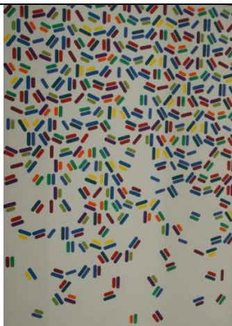
Christian de Cambiaire Processus graduel , s.d. Huile / acrylique sur toile 2,03 x 2,86 m Collection musée Goya N° inv. C 2010-0-8