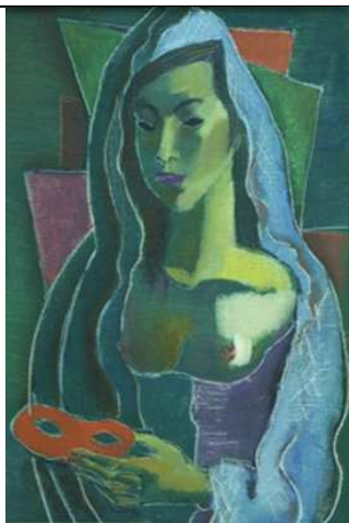
Georges Artemoff L'Espagnole , s.d. Huile sur toile 0,55 x 0,38 m Collection musée Goya N° inv. 56-1-1