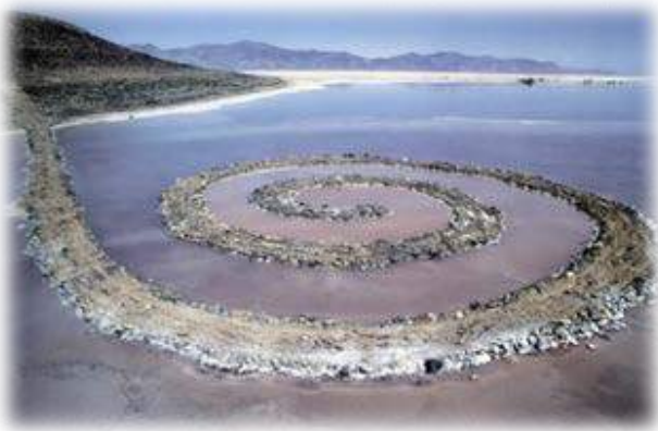
Spiral Jetty , Robert Smithson (1970)