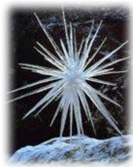
Icicle star (Étoile de glace), Andy Goldsworthy (1987)